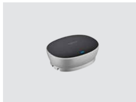
ANSCHLUSSMÖGLICHKEITEN UND VERWENDUNG

Erweitern Sie den Gesprächsbereich von 6 m (20 Fuß) auf 8,5 m (28 Fuß), damit auch die von der Freisprecheinrichtung weiter entfernten Personen deutlich gehört werden. Mikrofone (paarweise verfügbar) werden automatisch erkannt und konfiguriert, indem Sie sie einfach an die Freisprecheinrichtung anschließen.