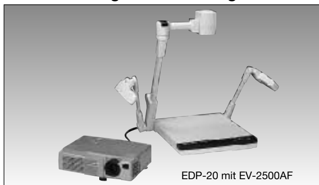
EDP-20 mit EV-2500AF

LCD Daten-/Video-Projektor EDP-X20 mit XGA-Auflösung (1024 x 768) plus SXGA komprimiert