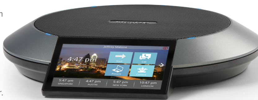
Große Anzeige mit benutzerfreundlicher Touchscreen-Oberfläche

Es wird Zeit, intelligenter zusammenzuarbeiten. Durch den radikal vereinfachten Cloud-Audio-, Web- und Videokonferenzservice in Verbindung mit einzigartigen Konferenzsystemen stellt Lifesize® Cloud 1 sicher, dass Ihre wichtigsten Geschäftsentscheidungen unabhängig vom Aufenthaltsort des Einzelnen persönlich getroffen werden. Und im Konferenzraum stellt Lifesize® Phone™ HD einen wesentlichen Bestandteil Ihrer Anwendung dar. Benutzer können ganz einfach Inhalte freigeben, Anrufe tätigen, an Meetings teilnehmen, Layouts ändern und vieles mehr. Mit Lifesize Phone HD haben Sie ein elegantes und benutzerfreundliches Paket und profitieren von allen Vorteilen der Lifesize Cloud.