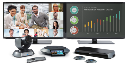
Lifesize® Icon 600™ mit optionaler Zwei-Display-Konfiguration für die Bildschirmfreigabe, Lifesize® Camera 10x™ sowie Lifesize Digital MicPods, die mit Lifesize Phone HD für große Räume verbunden sind.